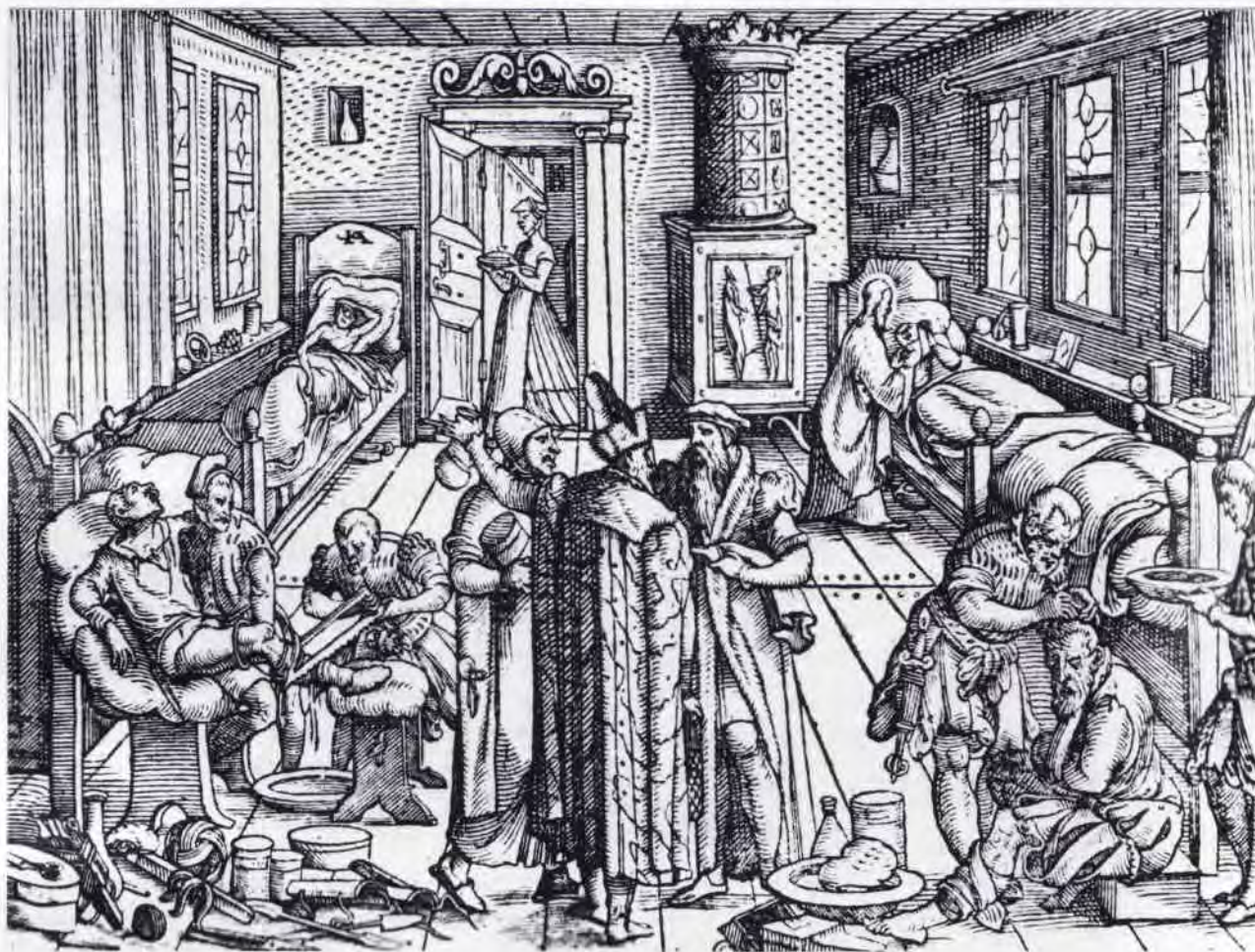
Frontespizio dell' Opus chirurgicum di Paracelso (volume impresso nel 1565, a Francoforte sul Meno)

conservato come pura testimonianza di ossequio, la memoria della medicina rinascimentale è stata pressoché rimossa, come se tutto ciò che appartiene all'era pre-galileiana sia qualcosa di cui vergognarsi. Questa voglia di liberarsi della cattiva coscienza di pratiche antiche, come magia, astrologia e alchimia, ha comportato un allontanamento da quella filosofia della natura, che consentiva al medico di rendersi conto che tutto è legato a tutto e che la scienza, da sola, non può dare risposta ad ogni quesito, senza una visione monistica dell'uomo e dell'universo.